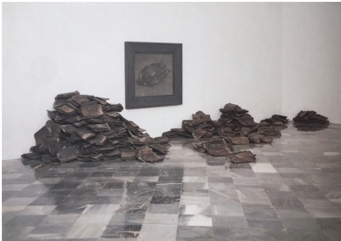
De anonieme getuigenis (1976-1985) , installation with black-and-white photograph in zinc frame, roof tiles