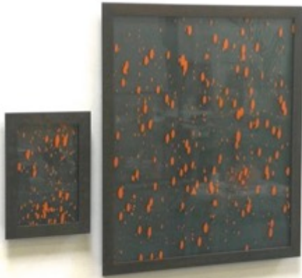
Depositum Saturnium (ongedateerd)

In de tentoonstelling Pieter Laurens Mol – Nachtlucht vormt de kleur zwart en de duisternis de leidraad om het oeuvre van Pieter Laurens Mol op een nieuwe manier te belichten. Mol beschouwt zwart als een verbindend element in zijn oeuvre. De inspirerende kracht en rijke symboliek van de kleur zwart en het duister maken deel uit van de thema's die hij aansnijdt en van de materialen die hij gebruikt. Zwart is verbonden met zijn persoonlijke lezing van de kunstgeschiedenis en met zijn interesse in de alchemie, de kosmos en de ruimtevaart, met zijn liefde voor de nacht en het tweeduister en staat zo mede garant voor de melancholische ondertoon die verweven is met zijn kunstpraktijk.