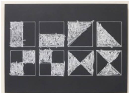
De Lagere School, 2021(1981)