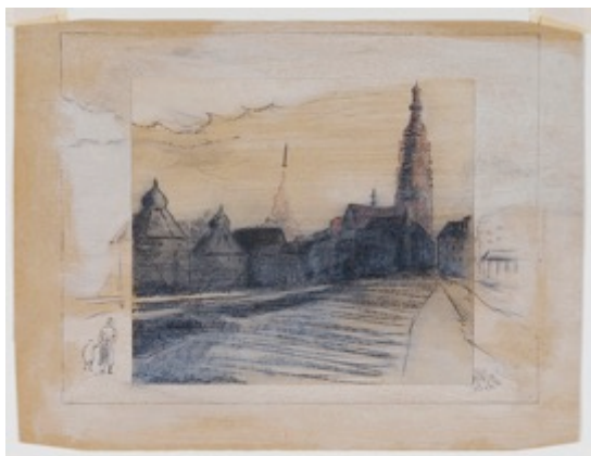
Raketstart vanuit de Bredase binnenstad, 1965

Internationale museale collecties o.a. MuHKA (Antwerpen, België), de Staatsgalerie in Stuttgart (Duitsland), het Philadelphia Museum of Art en The Museum of Modern Art in New York (beiden VS). Ook is zijn werk opgenomen in veel privécollecties in zowel binnen- als buitenland. Mol wordt momenteel gerepresenteerd door (Galerie) Parrotta Contemporary Art (Keulen en Bonn), Hidde van Seggelen Galerie (Hamburg) en April in Paris Fine Arts (Aerdenhout).