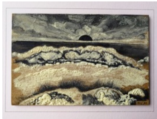
The Black Sun sets (ongedateerd)

Vanuit een verbondenheid met verschillende materialen onderzoekt Mol wat zwart en duister in de geschiedenis betekend heeft. Hij bespeurt daarbij een aan verandering onderhevige rol in de kunsten en wetenschappen. Dat wordt zichtbaar in zijn materiaal- en kleurgebruik. Houtskool en zwarte inkt, teer en de veren van een raaf zijn directe aanwijzingen. Maar ook hoe verschillende kleuren zich tot het onderwerp verhouden is belangrijk: denk aan de iriserende kleuren die zichtbaar worden door een olievlek op nat zwart asfalt of het bleekgele zwavel dat zijn toepassing kent als bestanddeel van zwart buskruit. Kenmerkend is zijn schilderwerk met orangerode loodmenie die als een haast romantisch avondrood verwijst naar Saturnus en de melancholie.