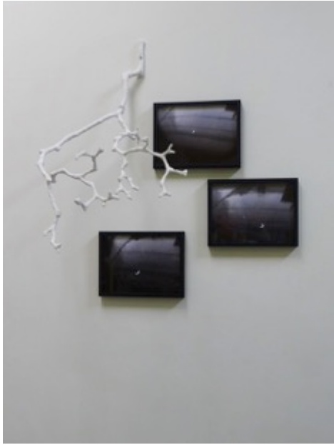
Crescent Reverie (2015)