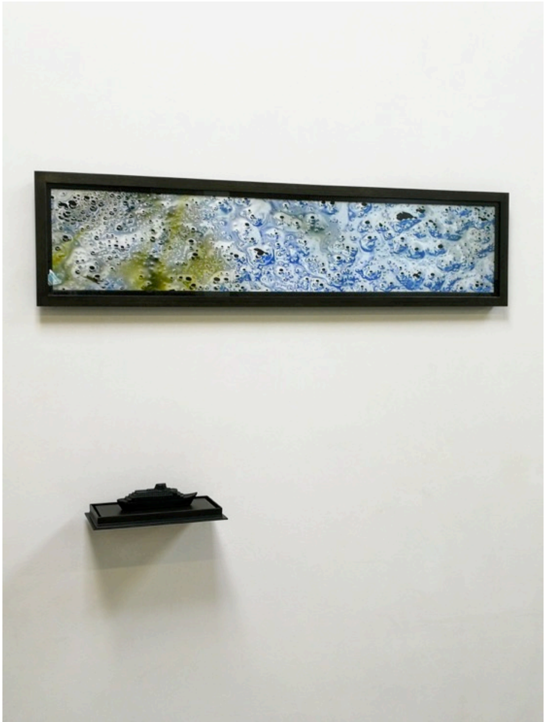
Sailing the Sea of Colour (2021)