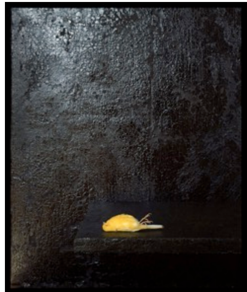
Nature Morte (Kanarie in Kolenmijn) (2004-2005)