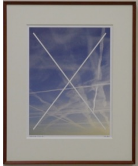
Cancellation (Either Way) (2014)